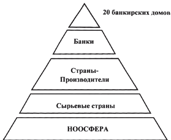
Рис. 1. Пирамида капитализма

Неолиберализм – идеология капитализма. Призывая к свободе индивида во всех сферах деятельности и рассматривая все общественные связи в терминологии рынка, а каждое социальное взаимодействие как контракт (акт купли-продажи), постулируя максимальное устранение государства из всех сфер человеческой жизни, неолиберализм создает идеологическую основу для сосредоточения фактической власти в руках крупных финансовых институтов.